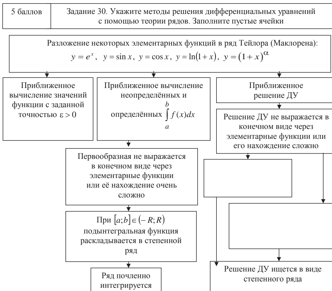
Рис. 3. Задание 30 модульной контрольной работы, сформулированное в виде структурно-логической схемы

Здесь рейтинг итоговой аттестации (сдачи экзамена или зачета) рассчитывается из 30 максимальных баллов. Рейтинг учебной работы составляет не более 70 баллов и содержит R_{\text{м1}} и R_{\text{м2}} – баллы студента по первому и второму смысловому модулю соответственно, изучаемым за текущий семестр, из расчета 100-бальной системы; \hat{E}_1 и \hat{E}_2 – число кредитов, предусмотренных рабочим учебным планом для соответствующего смыслового модуля. Если в течение семестра изучается один модуль, то в данной формуле числитель и знаменатель дроби содержат только первые слагаемые.