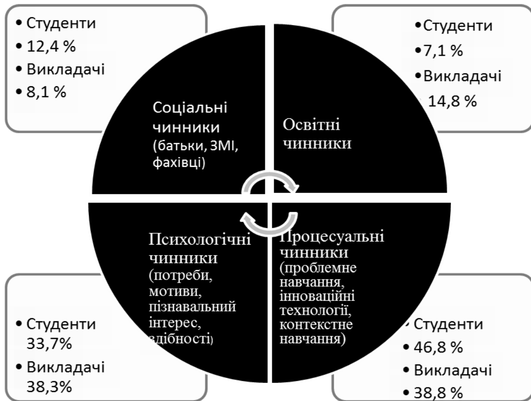
Рис. 1. Вплив чинників на професійну підготовку майбутніх менеджерів організації

Мотиваційний аспект є рушійною силою людської діяльності, до складу якої входить і навчання. Мотив – це внутрішня рушійна сила, що спонукає людину до діяльності.