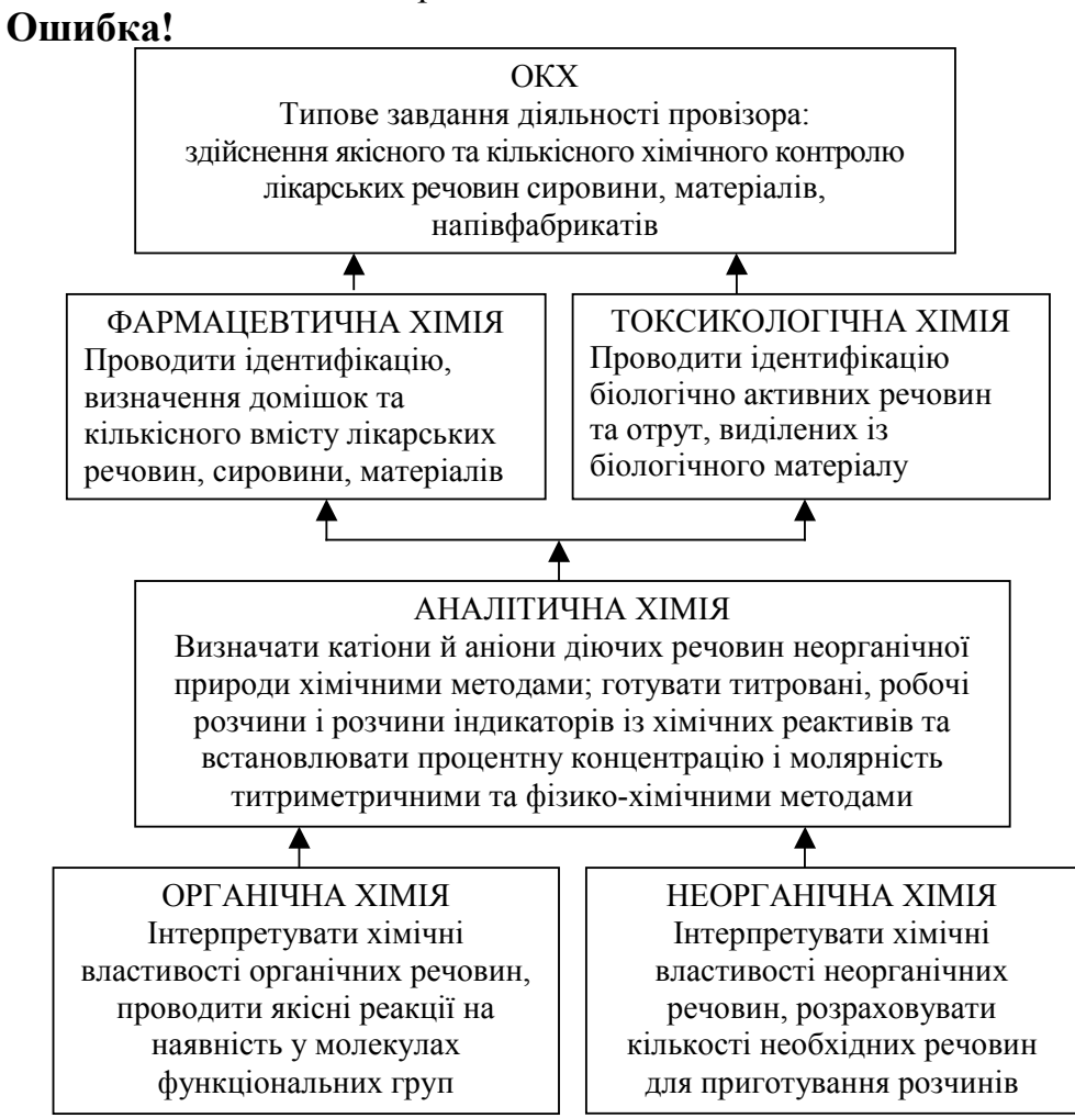
Рис. 1. Схема формування професійного вміння провізора: "Здійснення якісного та кількісного хімічного контролю лікарських речовин" у курсах хімічних дисциплін

Взаємозв'язок цілей різних хімічних дисциплін для реалізації кінцевої мети навчання для формування уміння "Проведення якісного та кількісного хімічного контролю речовин" наведено на рис. 1. Після визначення основних цілей дисциплін викладач визначає тематичні цілі, а також конкретні цілі та навчальні завдання до кожної лекції або практичного заняття.