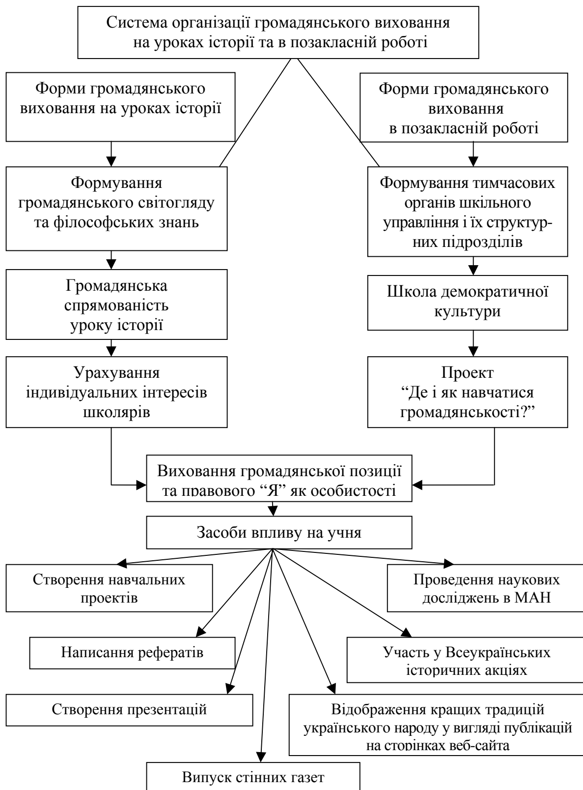
Рис. 1. Модель формування громадянського виховання школярів на уроках історії та в позакласній роботі

Вчитель історії має можливість засобом свого предмета, змістом історичного матеріалу, який вивчається, “формуванню позитивного ставлення до пізнавальної діяльно-