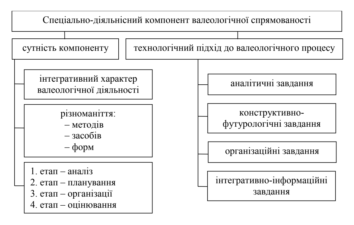
Рис. 1. Структура та показники спеціально-діяльнісного компонента валеологічної спрямованості майбутніх фахівців фізичного виховання

серед інших виділяють такі риси: новаторство й незалежність поглядів, прагнення до пізнання нового, сміливість і рішучість у діяльності. Крім того, О. Леонтьєв виділяє ще й такі риси, як: критичність суджень, самобутність, почуття гумору, готовність до ризику тощо [7]. Разом з тим І. Бердников зазначає, що валеологічна діяльність учителя набуває креативного характеру в тих ситуаціях, коли алгоритмічний підхід виявляється нерезультативним [3]. Валеологічна спрямованість освіти передбачає формування таких умінь, як аналіз і синтез навколишніх явищ, морально-етичних відносин між людьми й відносин людини із зовнішнім світом. Крім того, валеологічно спрямована особистість завжди дотримується моральних принципіву спілкуванні з усіма представниками соціуму. Перелічені вище риси валеологічно спрямованої особистості стають базисом для розвитку її креативності.