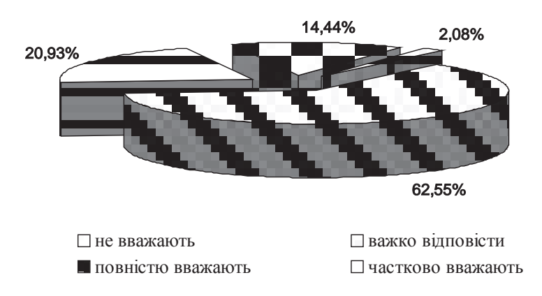
Рис. 1. Розподіл відповідей працівників, щодо підготовки юристів до Державної пенітенціарної служби України як у відомчих вищих навчальних закладах, так і в інших, (%)

На запитання анкети "Наскільки Ви згодні з думкою, що підготовка юристів до Державної пенітенціарної служби України повинна здійснюватись як у відомчих вищих навчальних закладах, так і у інших вищих навчальних закладах?" відповіли, що повністю, — 62,55%; частково — 20,93%; ні — 14,44%; важко відповісти — 2,08% (рис. 1).