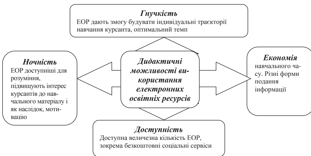
Рис. 2. Дидактичні можливості використання ЕОР

Згідно з визначенням ЮНЕСКО, до освітніх ресурсів, що розміщують в Інтернет, належать навчальні й наукові ресурси, які існують у відкритому доступі або випущені за ліцензією, яка дає змогу безкоштовно їх використовувати і модифікувати третіми особами [7].