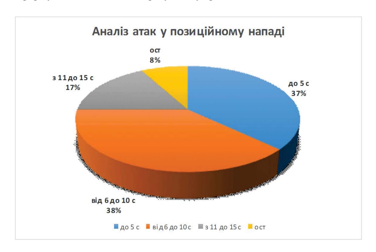
Рис. 1. Аналіз атак у позиційному нападі

Причому, якщо в межах до 5 с проводиться 29,91 атак, або 37%, а від 6 до 10 с 30,02 атак, або 38%, то за період з 11 до 15 с проводиться 13,27 атак, або 17%. У більш віддаленому часовому діапазоні (16–20 с і 21–25 с) загальна кількість атак не перевищує в першому випадку 6,5% (5,16 атак) і в другому – 1,5%, або 1,19 атак, що, на наш погляд, не суттєво для формування позитивного результату гри.