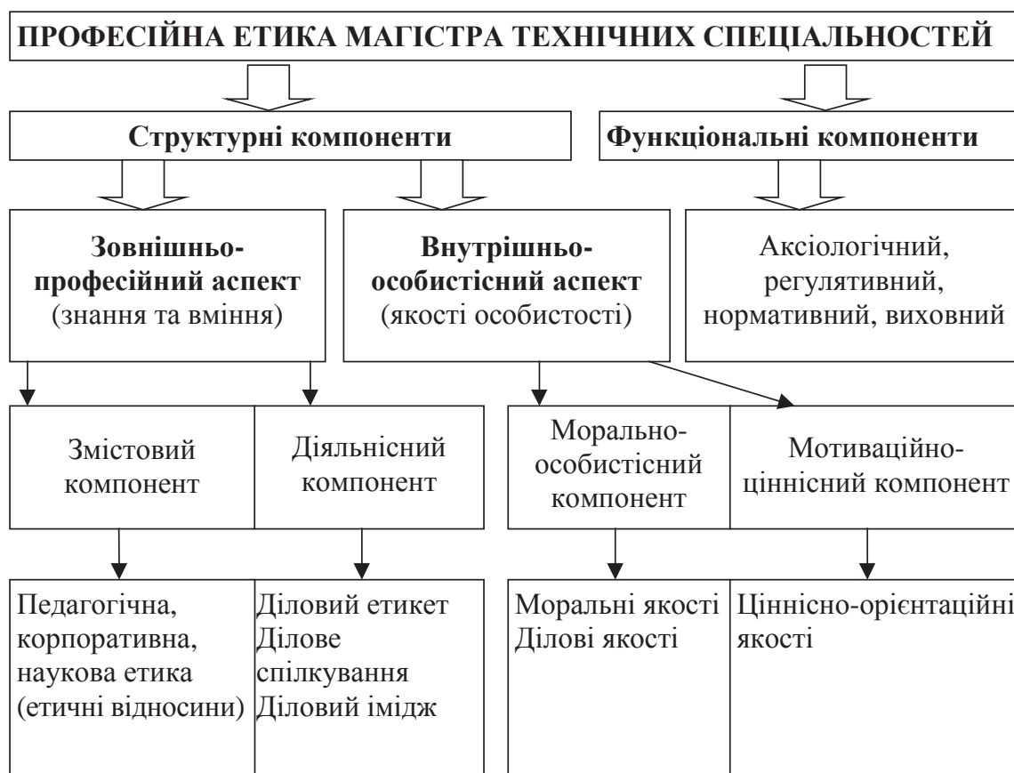
Рис. 2. Сутність професійної етики магістрів технічних спеціальностей

Отже, проаналізована нами багатоплановість і багатофункціональність професійної діяльності магістрів технічних спеціальностей, розмаїття напрямів моральних відносин, пов'язаних із професійною діяльністю магістрів, а також висока ступінь відповідальності, яку несуть магістри технічних спеціальностей говорить про вагоме місце професійної етики магістрів технічних спеціальностей у їх професійній підготовці.