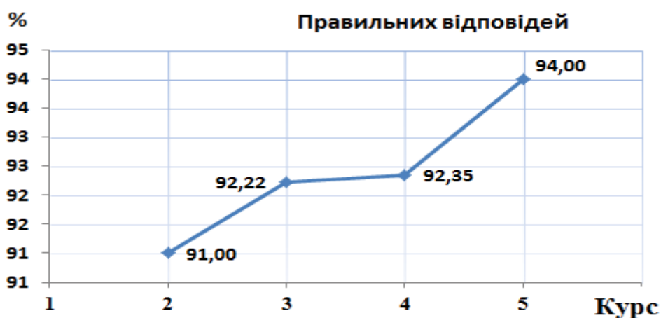
Рис. 2. Результати тестування студентів – майбутніх педагогів-валеологів за наявністю навичок з оцінювання знань учнів (тест № 2)

Результати тестування студентів – майбутніх педагогів-валеологів II–V курсів за тестом № 2 подано на рис. 2. Тестування рівня знань (тест № 2) складалося з 10 запитань, серед яких: “Знання – це...”; “Оцінка знань – це...”; “Якість знань – це...”; “Уміння – це...” тощо.