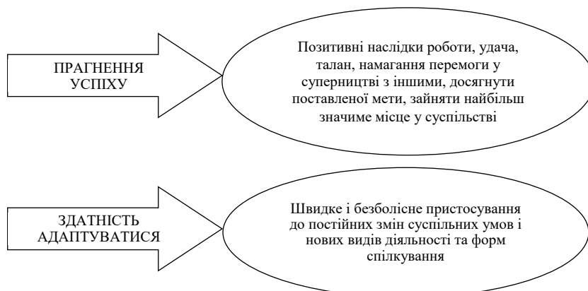
Рис. 1. Особливі ознаки конкурентоспроможності особистості

Автономія як духовна цінність (вона ж свобода та незалежність) пов'язана з можливістю вибору як кар'єрного, професійного, так і життєвого шляху, прагненням до досягнення поставленої мети. Людина управляє собою, якщо вона має особисту автономію. Вона мислить та поводить відповідно до власних бажань відповідно до зовнішніх або внутрішніх спонукань. Отже, конкурентоспроможний фахівець має бути автономним, мати нетрадиційний підхід під час виконання діяльності, індивідуалістичний стиль діяльності, впертість, протистояння тиску групи та наказам, самостійне прийняття рішень. Ринкова еко-