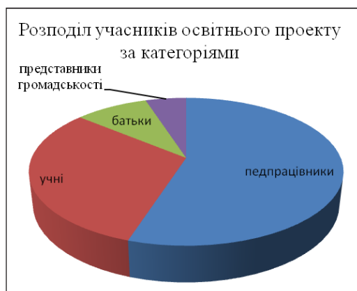
Рис. 1 Розподіл учасників освітнього проекту за категоріями

Впровадження освітнього проекту «Партнерство як ресурс» здійснюється з вересня 2018 року по теперішній час. За зазначений період взяли участь 100 учасників, із них: 55 – педагогічні працівники, 31 – учні, 5 осіб – представники громадських організацій, 9 осіб – представники батьківських колективів закладів загальної середньої освіти Одеської області. На (рис. 1) представлено розподіл учасників освітнього проекту за категоріями.