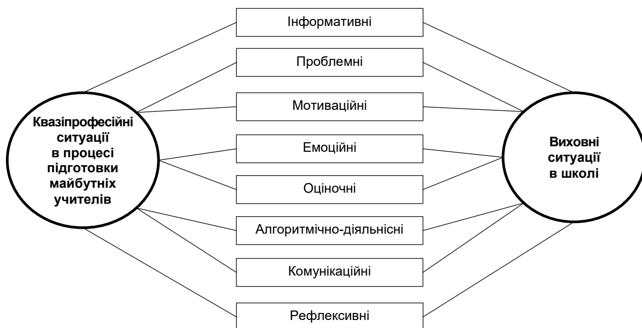
Рис. 2. Типи квазіпрофесійних та виховних ситуацій

Висновки. Отже, розроблена нами модель сприяє формуванню успішного вчителя початкової школи, здатного використовувати у виховному процесі теоретичні знання основ толерантного виховання, виявляти полікультурний світогляд, виявляти критичне мислення, мати