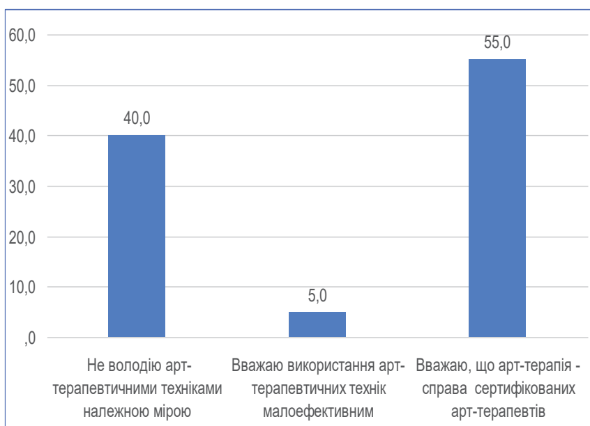
Рис. 2. Причини невикористання технік арттерапії в інклюзивному просторі ЗОШ (%)

Що стосується зацікавленості респондентів у знаннях з інших арттерапевтичних технік, то вона нижча. Зокрема, у вивченні арттехніки казкотерапії зацікавлені 13% опитаних. Втім, як показують інші результати дослідження, це навряд чи свідчить про те, що казкотерапія має