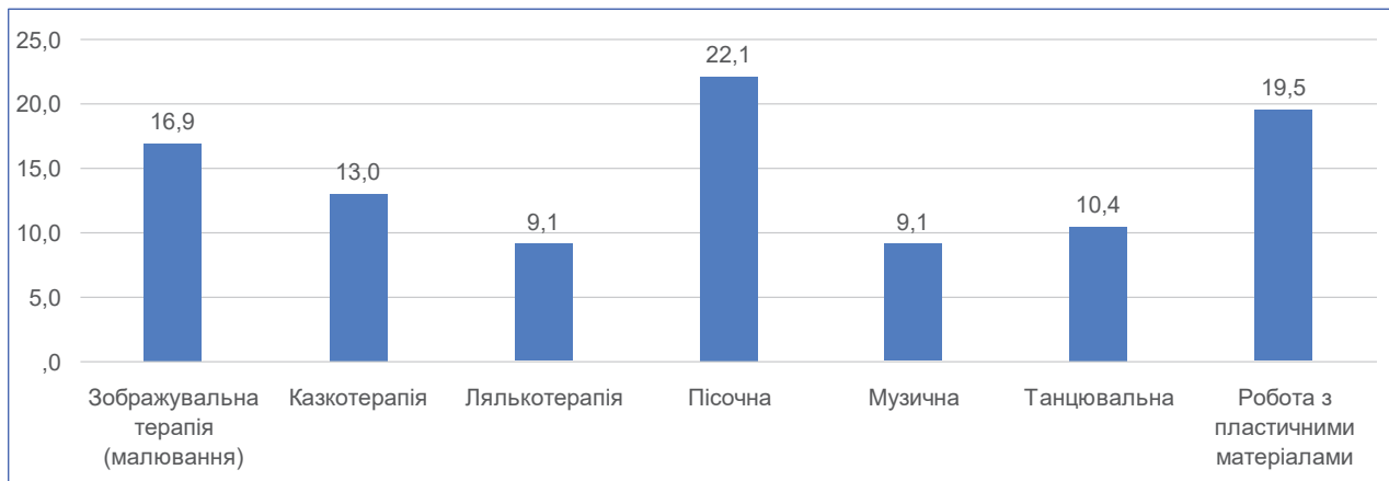
Рис. 3. Рівень зацікавленості освітян у знаннях з окремих різновидів арттерапевтичних технік (%)

низьку популярність в інклюзивному просторі. Так, на наше прохання оцінити свій рівень знань арттерапевтичних технік за різновидом «казкотерапія» лише 20% респондентів визнали свій рівень низьким. Натомість більшість респондентів мають хороші знання з казкотерапії, а отже, можуть активно її використовувати в педагогічній роботі з дітьми з особливими освітніми потребами (рис. 4).