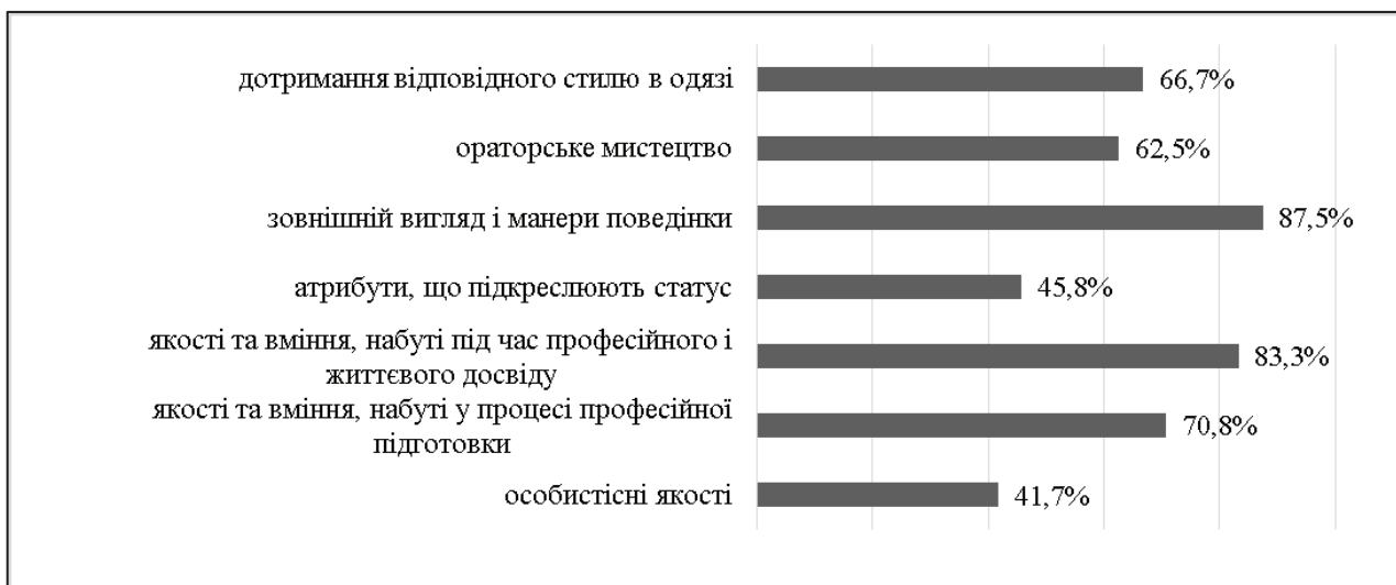
Рис. 1. Відповіді на запитання «Виберіть характеристики, які, на Вашу думку, входять у структуру позитивного іміджу педагога?»

У процесі з'ясування сутності поняття іміджу педагога для нас є авторитетною думка дослідниці Т. Марєєвої, яка зазначає, що він формується сам собою, стихійно, у процесі взаємодії з дітьми,