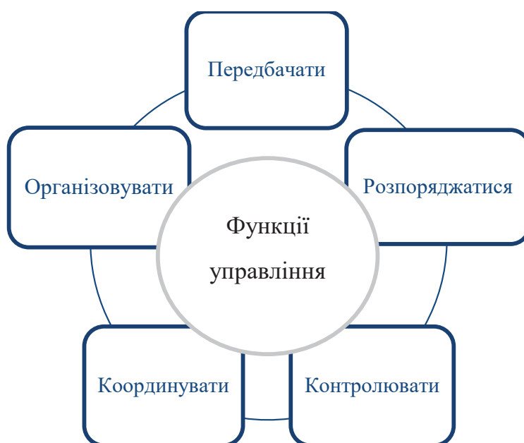
Рис. 1. Функції управління за А. Файолем

На нашу думку, структура та функції сучасного педагогічного самоменеджменту мають відрізнятися від класичної управлінської моделі врахуванням передових концепцій менеджменту та