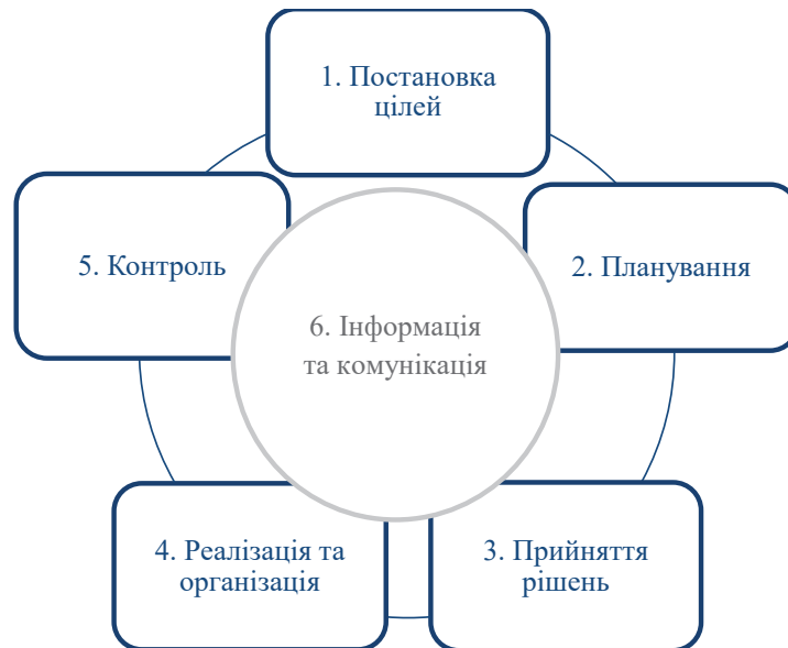
Рис. 2. «Коло правил» Л. Зайверта

психології, які характеризуються необхідністю максимального виключення елементів примусового керування, віддаючи перевагу особистісній орієнтації через психологічні чинники теорій мотивації та саморегуляції. Отже, ми вважаємо, що систему функцій педагогічного самоменеджменту варто вибудовувати, відштовхуючись від принципів та завдань самої концепції менеджменту, яка передбачає створення самоорганізованої системи, якою у цьому разі виступає сам індивід.