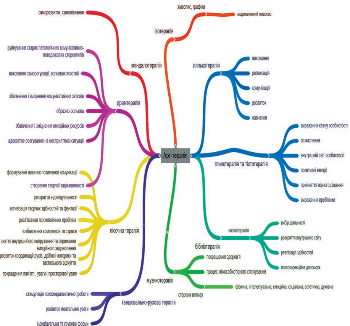
Рис. 2. Ментальна карта алгоритмізації засобів системи арттерапії

Порівнюючи показники до та після використання розробленої членами науково-дослідної групи педагогічної моделі (рис. 1) встановлено, що результати (надано на рис. 3) отримані наприкінці педагогічного експерименту у досліджуваних групах суттєво підвищилися порівняно з вихідними даними, і ці відмінності переважно достовірні (Ег, P<0,05).