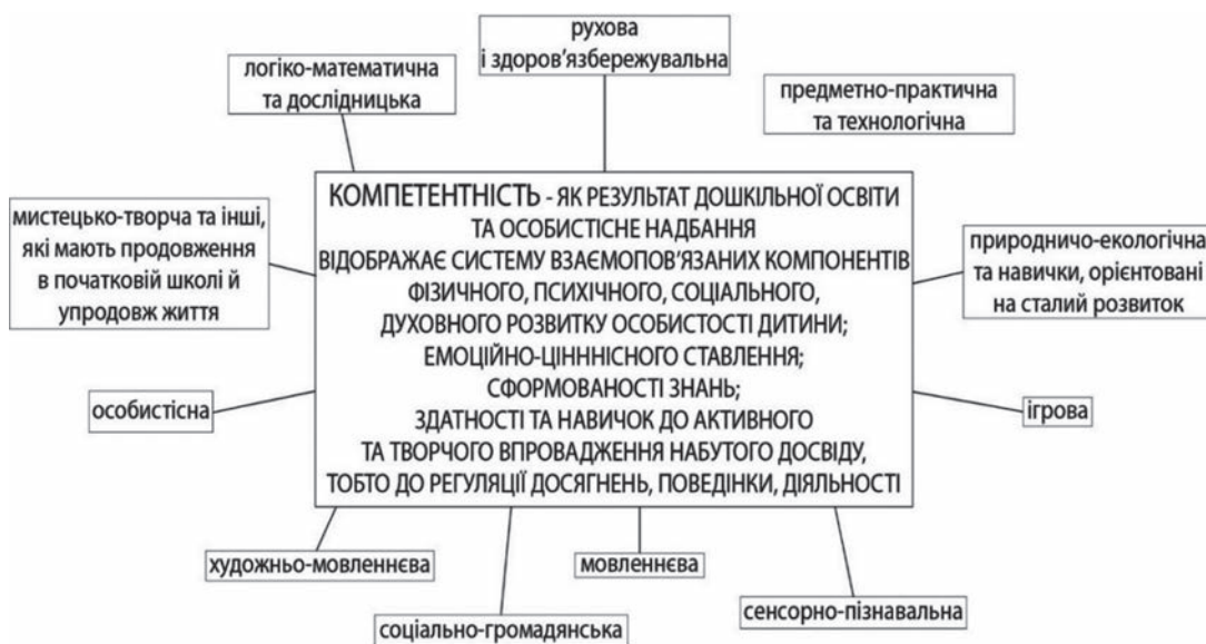
Рис. 2. Ключові компетентності дитини дошкільного віку