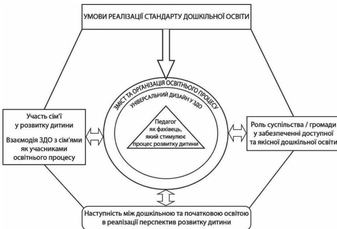
Рис. 3. Умови реалізації освітньої діяльності закладу дошкільної освіти

оцінювання. Мова йде про те, що інформація, зібрана для оцінювання має об'єктивно відображати комплексно реальний стан організації освітньої діяльності як системи, що в свою чергу сприятиме пошуку оновлених форм і методів реалізації освітнього змісту, контролю та оцінки результатів діяльності всіх суб'єктів освітнього процесу. Одержана інформація має об'єктивно відображати освітні цілі, конкретні завдання, власне структуру та етапи організації й управління освіт-