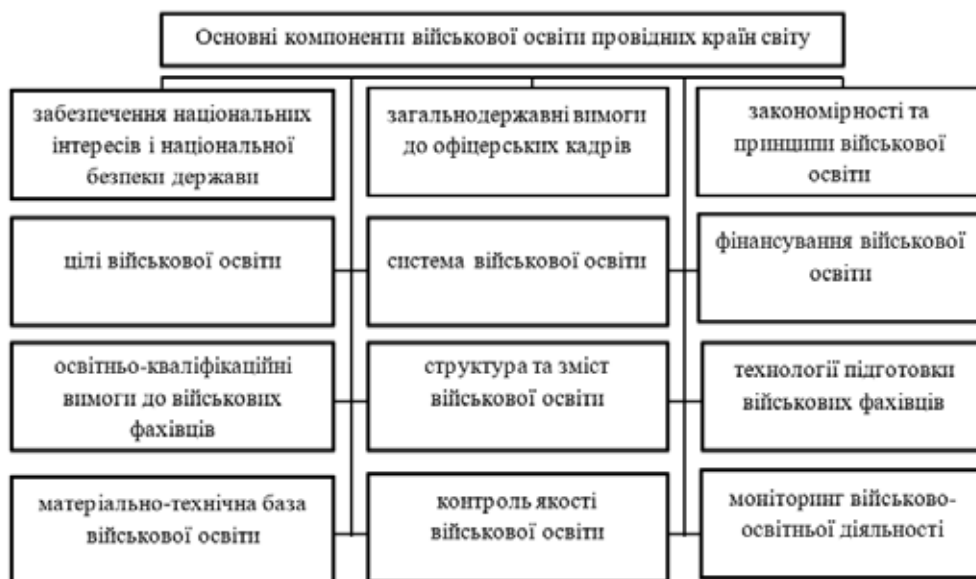
Рис. 1. Структурна побудова військової освіти провідних країн НАТО

У Великій Британії навчання військовослужбовців та кар'єрний ріст перебувають в прямій залежності один від одного. Так, перші 2-3 роки служби вони мають бути зацікавленими і самостійно проявляти ініціативу в опануванні якнайбільшого спектру профільних дисциплін, адже у випадку відсутності просування за кар'єрними сходами протягом 4 років сукупно, піднімається питання щодо доцільності подальшого проходження служби таким офіцером. Зміна спеціалізації відбувається кожні 4-5 років. Вона обумовлена потребою отримання практичного досвіду при роботі в штабах, бойових частинах, кадрових органах, навчальних закладах, розумінні логістики тощо. Таким чином, за 25 років служби військовий розуміє принципи роботи у всіх сегментах, а