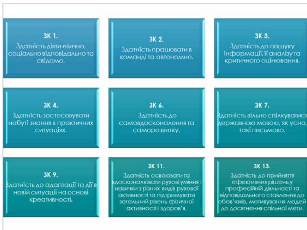
Рис. 1. Загальні компетентності, які формуються у процесі професійно-практичної підготовки здобувачів вищої освіти спеціальності Середня освіта (Фізична культура і спорт)

Серед переліку загальних компетентностей ( \Sigma = 13 ), які передбачені освітньо-професійною програмою дев'ять ( \Sigma = 9 ) формуються у процесі проходження різних видів практики (рис. 1).