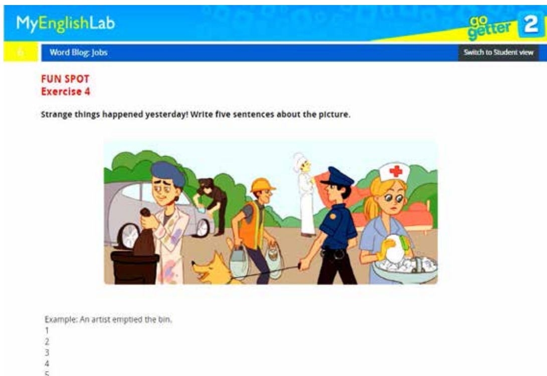
Рис. 7. Письмове онлайн-завдання до теми 6 у Go Getter 2

Розглянемо тепер класифікацію письмових інтернет-завдань. Першим критерієм візьмемо жанр.