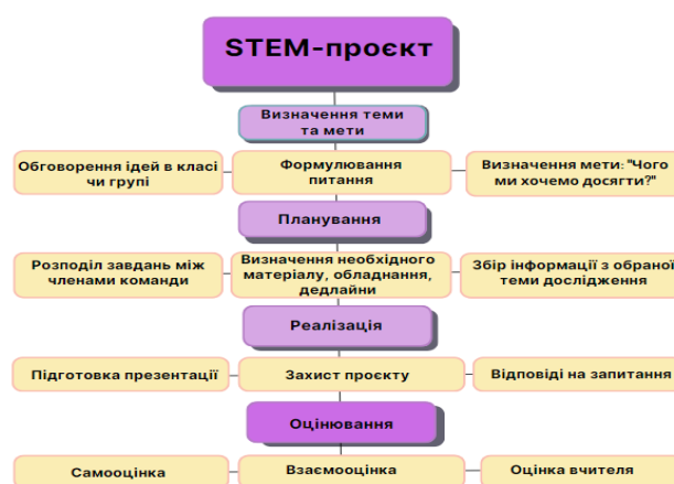
Рис. 1. Схема реалізації STEM-проекту

Наведений алгоритм ілюструє схема (рис. 1), яка може бути використана вчителями для організації STEM-проектів у класі, а учнями – як опорна схема для самостійного планування та виконання проектів.