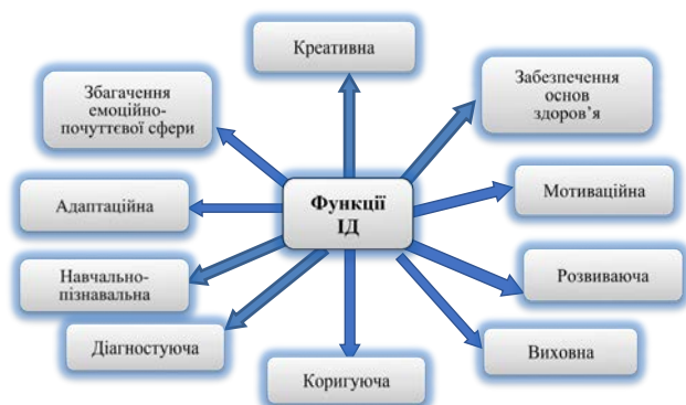
Рис. 1. Функції ігрової діяльності

З метою виявлення основних закономірностей розвитку фонематичних процесів правильної організації комплексної корекційної роботи необхідно провести детальне дослідження враховуючи усі показники мовленнєвого розвитку дитини з особливими освітніми потребами (формуванню акустичних, артикуляційно-кінестетичних і артикуляційно-кінетичних характеристик фонем), що є необхідною умовою для її засвоєння дітьми з ООП.