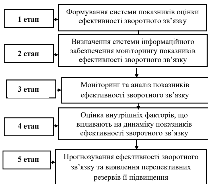
Рис. 3. Етапи оцінки ефективності зворотного зв'язку

Система інформаційного забезпечення процесу зворотного зв'язку повинна уявляти собою функціональний комплекс, що забезпечує безперервний цілеспрямований підбір відповідних інформативних