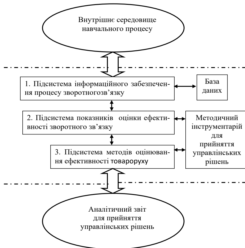
Рис. 2. Структурна модель оцінювання ефективності зворотного зв'язку

Оскільки оцінювання ефективності зворотного зв'язку має відбуватися у певній послідовності, виділимо основні рекомендовані його етапи (рис. 3).