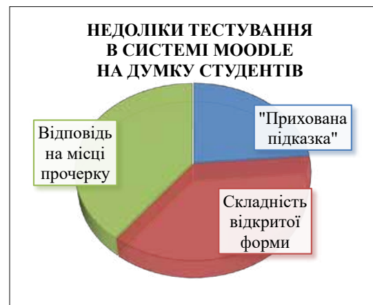
Рис. 2. Недоліки організації тестування в системі Moodle на думку студентів

43% опитаних студентів вважають недоліком наявність «прихованої» підказки на питання – обирати відповідь набагато легше, ніж писати його повністю самостійно (рис. 2).