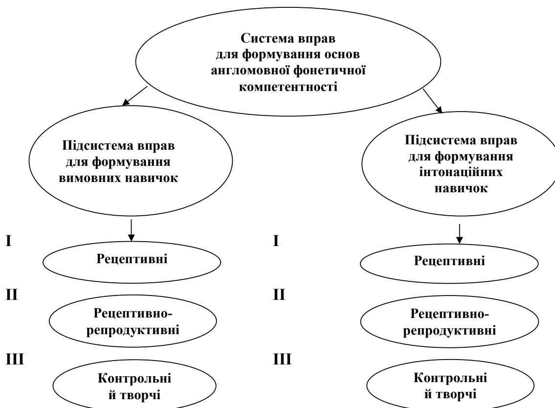
Рис. 1. Система вправ для формування основ англомовної фонетичної компетентності на ранньому ступені навчання

За С.Ю. Ніколаєвою навчання звуків ІМ починається з ознайомлення учнів із новим звуком ІМ (за аналітико-імітативним методом), після чого вчитель повинен організувати автоматизацію дій учнів із новим звуком [3]. Беручи за основу вище сказане, ми пропонуємо систему формування основ ФК