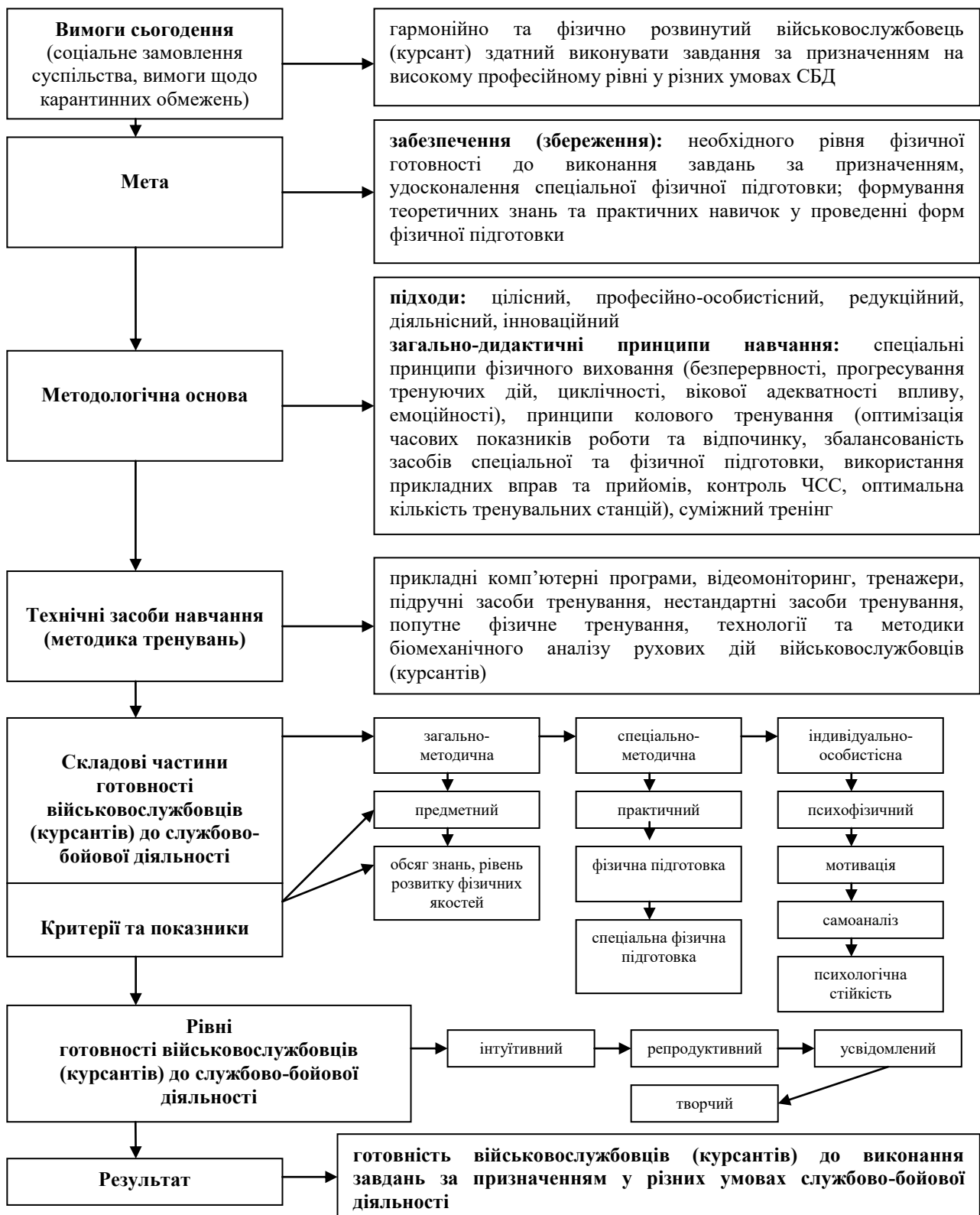
Рис. 1. Педагогічна модель формування професійних компетентностей майбутніх офіцерів Національної гвардії України із використанням нових форм фізичного виховання (підготовки) в умовах карантинних обмежень