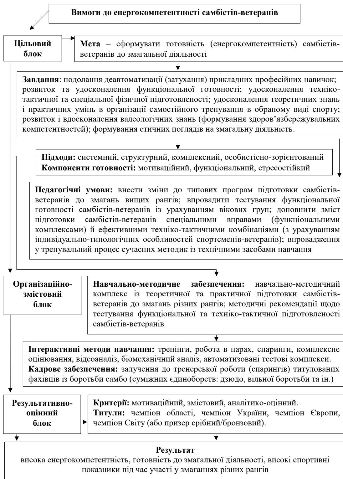
Рис. 1. Змістово-функціональна модель формування енергокомпетентності у самбістів-ветеранів (40–45 р.)

зазначеного періоду педагогічного експерименту, що призвело до позитивних змін у функціональній, техніко-тактичній і спеціальній фізичній підготовленості досліджуваних самбістів-ветеранів Ег. Порівнюючи показники до та після використання запропонованої нами педагогічної моделі, ми встановили, що результати (рис. 2), отримані